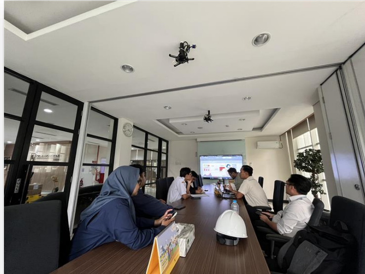
Diskusi dan Melengkapi Data yang Diperlukan Terkait dengan PLTS