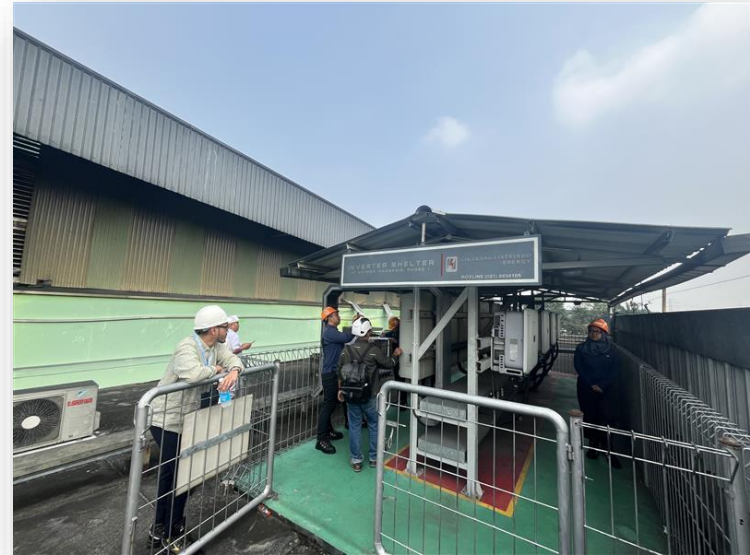
Kunjungan ke PT Kayaba Indonesia untuk Meninjau dan Mengambil Data yang Diperlukan Terkait PLTS