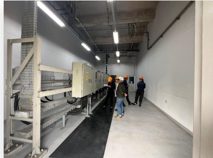
Kunjungan ke PT Mandom Indonesia Tbk untuk Meninjau dan Mengambil Data yang Diperlukan Terkait PLTS