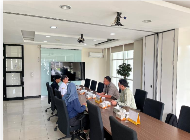
Penyambutan dan Diskusi Singkat antara Management PT Cikarang Listrindo Tbk dengan Dinas ESDM Prov. Jabar